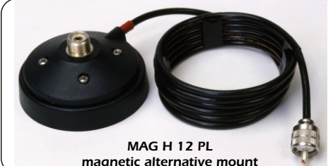
MAG H 12 PL magnetic alternative mount

Nota: la cartina autoadesiva è INDISPENSABILE per il corretto funzionamento elettrico della base magnetica.