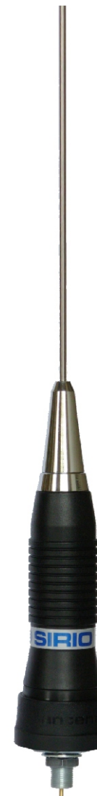
AS series N